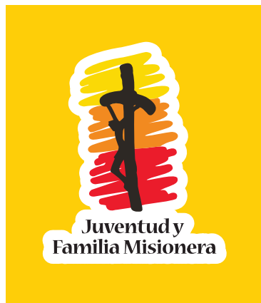
SOBRE FONDO CORPORATIVO