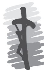
ESCALA DE GRISES